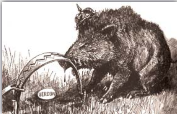
Brit karikatúra a verduni csatáról

Miért egy hatalmas vaddisznó szimbolizálja Németországot? Mire utal a csapdába esett állat rajza?