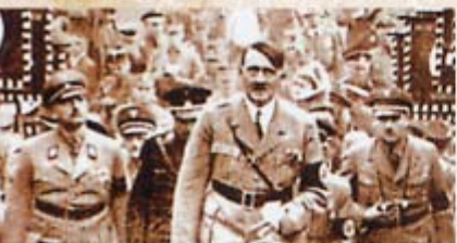
A nürnbergi pártgyűlés 1934-ben

Megtartották az első nyilvános tévéközvetítést Londonban.