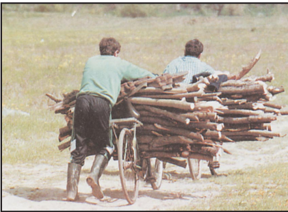
Tüzelőanyag gyűjtése kis faluban

rendeltségi viszonyban vannak. Ezt a társadalmi hierarchiát a modern, nyílt társadalmakban azonban át lehet lépni, senki sem esélytelen, aki tehetséges és szorgalmas, feljebb tud kerülni. A zárt társadalmak hierarchiájába az emberek beleszületnek, öröklik azt. (Például az indiai kasztok.) A nyitott társadalmakban azonban lehetséges a vertikális mobilitás is. Lehet egy munkás fia orvos, és fordítva.