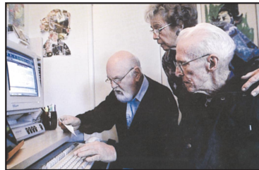
Kortól függetlenül is nyitottnak kell lenni a korszerűség iránt