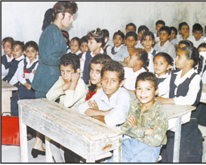
Iskola a Föld déli féltekén

hasznosabb, mint ha munkanélküli segélyeket osztogat az állam egyre magasabb vállalkozási adóiból. A lakóhelyek közötti lakosságáramlást horizontális mobilizációnak nevezzük.